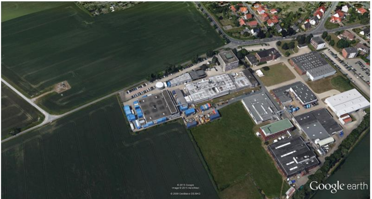
Abbildung 2: Standort Eckert & Ziegler Nuclitec GmbH und GE Healthcare Buchler GmbH & Co. KG in Braunschweig (Luftaufnahme)